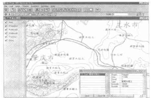
图2 应用 ArcView 编辑土壤专题图

远程客户端访问 WebGIS 土壤空间信息专题图, 需具备与 Internet 连接条件, 具有 WWW 浏览器, 如 Internet Explorer(IE) 5.0Ver 或 Netscape Navigator 3.0 Ver 以上版本, 同时 WWW 浏览器必须能够支持 JAVA 程序的运行。