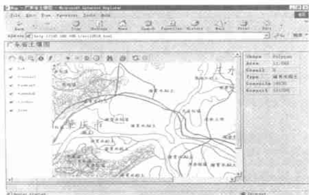
图 3 浏览器访问的土壤专题图 WebGIS 页面(http 为虚拟网址) Fig. 3 WebGIS View of soil special map by Browser(http is fictitious)

WebGIS 土壤专题图根据预设查询对象图层的要素类型, 设置属性窗口的查询显示结果的项目。对于查询要素图层为多边形的土壤专题图层等, 主要的显示项目是图斑面积、图斑的属性类型名称、编码值等; 对于由多层图叠加后的综合图层, 主要的显示项目是图斑面积、各类图层在该图斑位置的对应属性类型等; 查询要素图层为线形的如地形图图层, 主要的显示项目是高程等。