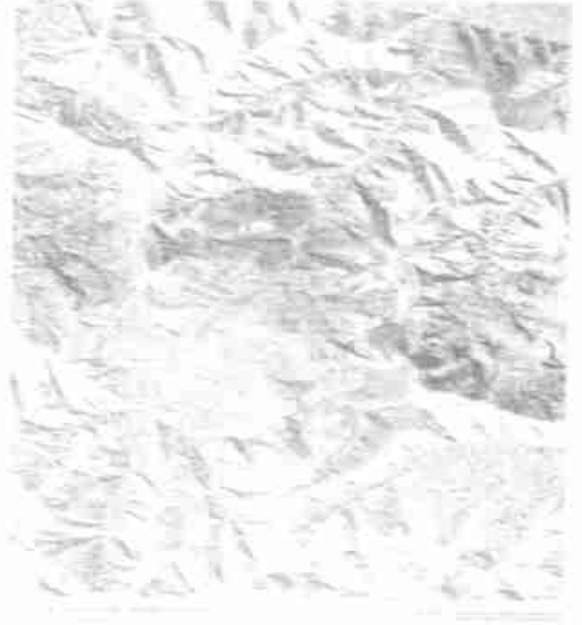
图 2 纸坊沟流域的数字正射影像地图

数据和影像数据等. 三维透视景观图是在正射影像图的基础上叠加数字高程模型, 因此它的真实感和立体感很强, 该图能比较清楚直观地反映区域内地形信息, 包括各沟道流域等其他二维图形反映不到的区域 [7] . 图 3 为纸坊沟流域的沟口三维透视景观图.