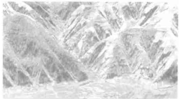
图 3 纸坊沟流域的沟口三维透视景观图